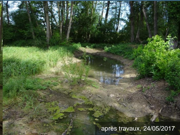
après travaux, 24/05/2017