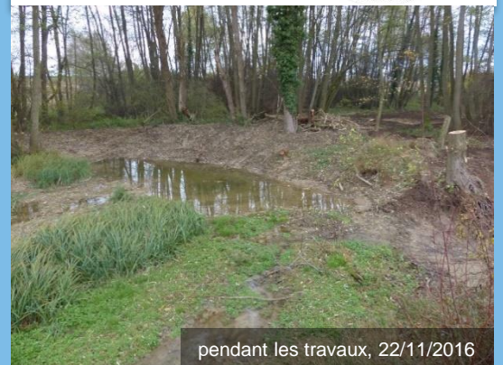
pendant les travaux, 22/11/2016