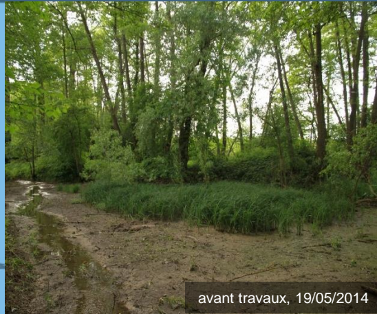
avant travaux, 19/05/2014