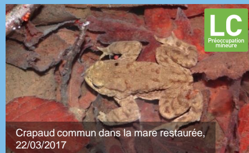
Crapaud commun dans la mare restaurée, 22/03/2017