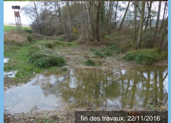
fin des travaux, 22/11/2016