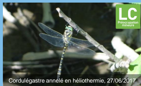
Cordulégastre annelé en héliothermie, 27/06/2017