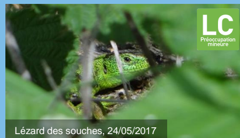
Lézard des souches, 24/05/2017