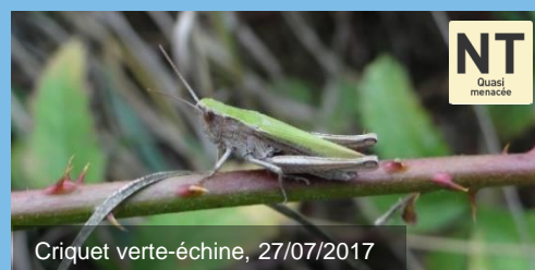
Criquet verte-échine, 27/07/2017