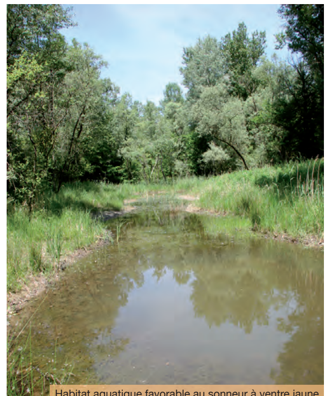
Habitat aquatique favorable au sonneur à ventre jaune

Les facultés de déplacement et de colonisation de cette espèce ont probablement été sous-estimées pendant longtemps et sont en réalité relativement importantes.