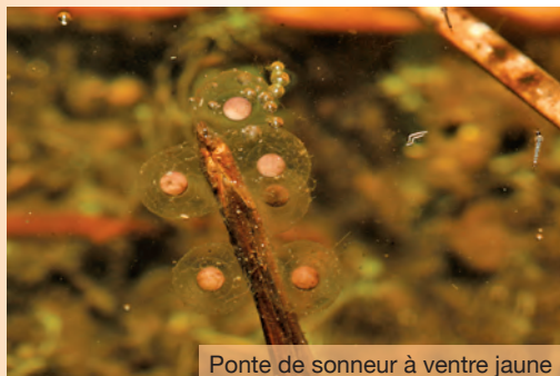
Pontes de sonneur à ventre jaune

Le sonneur à ventre jaune est un anoure de petite taille (40 à 50 mm) d'aspect général ramassé avec un museau arrondi. Il se reconnaît facilement à ses yeux dont l'iris doré est percé par une pupille en forme de cœur. Son plastron ventral avec des tâches noires, parfois légèrement bleuâtre, sur fond jaune ou orangé, le rend également facilement reconnaissable. La disposition et la forme des tâches est une combinaison unique à chaque individu et constitue une véritable «carte d'identité». Il se camoufle facilement grâce à son dos brun clair à foncé voire grisé, recouvert de petites verrues cutanées souvent rehaussées de petites épines noires cornées. Le dimorphisme sexuel est peu marqué chez cette espèce, le mâle possède des callosités nuptiales foncées sur la face interne de ses avant-bras.